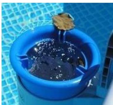
Ilustrační foto. Může se lišit od skutečnosti.

Skimmer slouží k zachytávání mechanických nečistot z hladiny vody v bazénu.