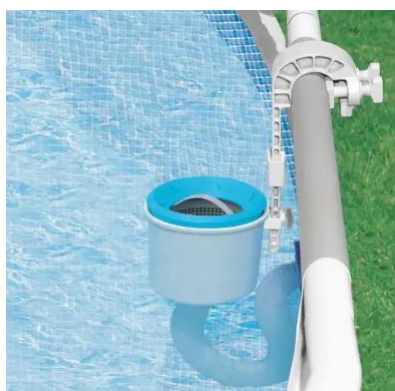
Ilustrační foto. Může se lišit od skutečnosti.