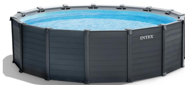
Ilustrační foto Graphite bazénu.