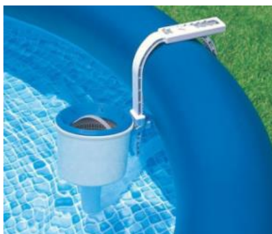
Ilustrační foto. Může se lišit od skutečnosti.