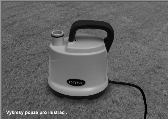
Výkresy pouze pro ilustraci.

Nezapomeňte vyzkoušet i jiné skvělé výrobky Intex: bazény, bazénové příslušenství, nafukovací bazény a domácí hračky, matrace a lodě, které jsou k dispozici u znamenitých prodejců, nebo navštivte naše webové stránky.